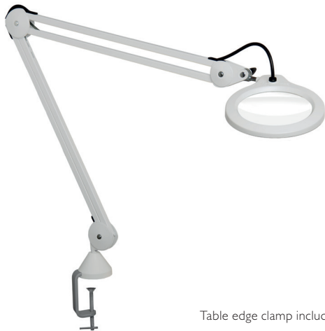
Table edge clamp included